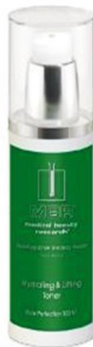
Hydrating & Lifting Toner