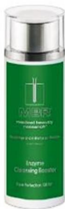
Enzyme Cleansing Booster